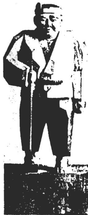
木彫自力更生農人像 (実物大)