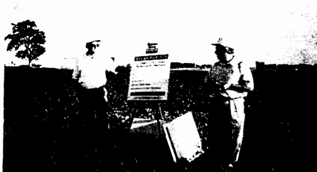
写真 1 Monsanto 社の農場教育

バイオダイズを植えている農家の人々を集めて、研究所のスタッフが講義をしている。背景に植えてあるのがバイオダイズ。農薬を撒くと農薬耐性のバイオダイズのみがきれいに成長する(右)。これに対して、対照区では雑草が生えて、バイオダイズとの区別がつかない(左)。