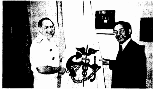
写真 2 FDA の元長官 Frank Young 博士と筆者 FDA (米国食品医薬品局) は食品や医薬品の安全性評価の問題で世界をリードしている。FDA は海軍に属しているため、錨のついた旗を立て、長官は海軍の軍服を着ている。

アメリカの政府関係者 (FDA, EPA; 米国環境保護局, USDA; 米国農務省) と話をしていると、問題点や疑問点はすべて取り上げ、実験して、徹底的に安全性を証明してみせるという熱意が感じられた。広い国であるが、どこへでも飛んで行って、説明や教育をするということであった。FDA をはじめとする政府機関の安全性の証明と教育、Calgene 社などの情報公開に